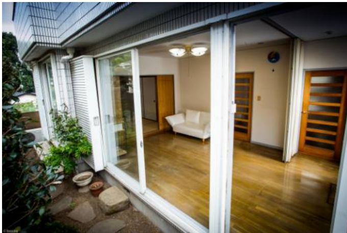
1Fスタジオ&リビング・スペース

1Fはイベント、スタジオ&リビング・スペース（オーナー共有）です。1F奥の畳ベッドルームの扉は閉まりますが、日常的にはオープン使用し、リビング・スペースと一続きとなります。